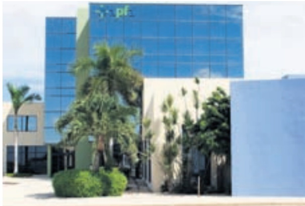
APFA: Prome diasabra di informacion tocante hypotheek